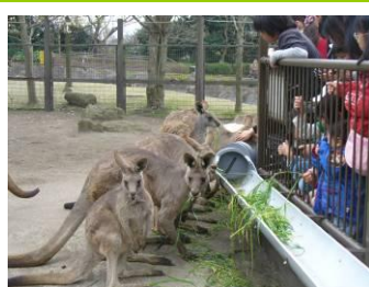
GWスペシャルガイド(アミメキリン・カンガルー)