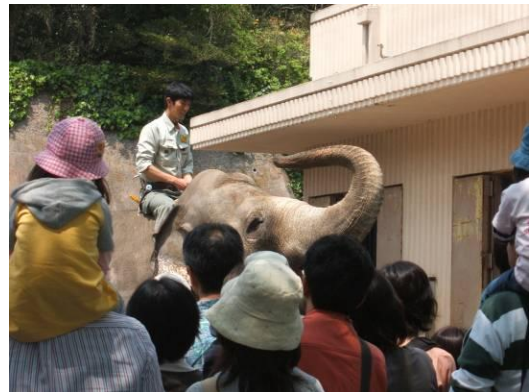
インドゾウガイド (イメージ)