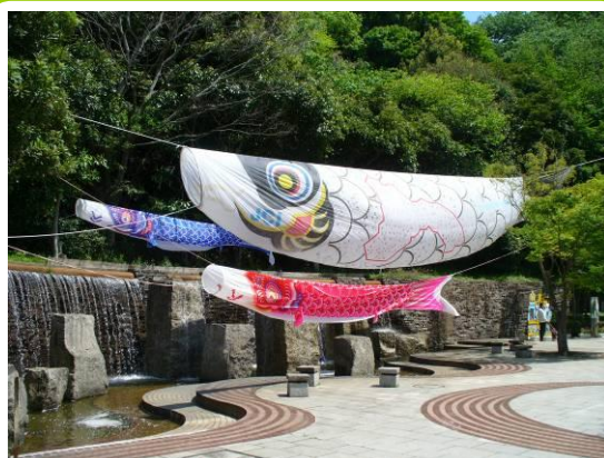
巨大こいのぼりドッティ