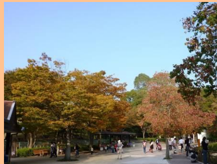
ケヤキとナンキンハゼ

アメリカ区オオツノヒツジ前のユリノキが色づき、大木で見応えがあります。モミジバフウも間もなくです。