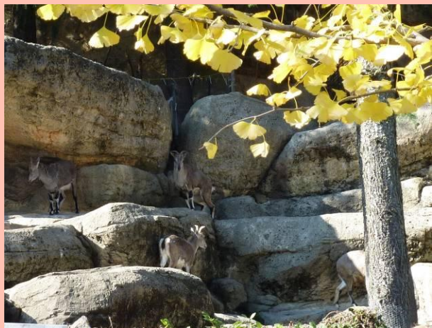
スーチョワンバーラルとイチョウ