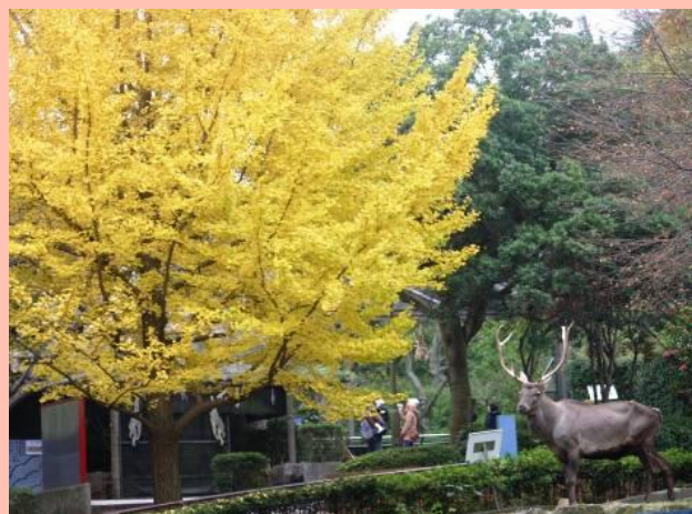
カンスーアカシカとイチョウ