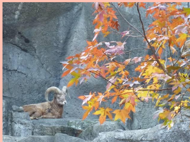
オオツノヒツジとモミジバフウ