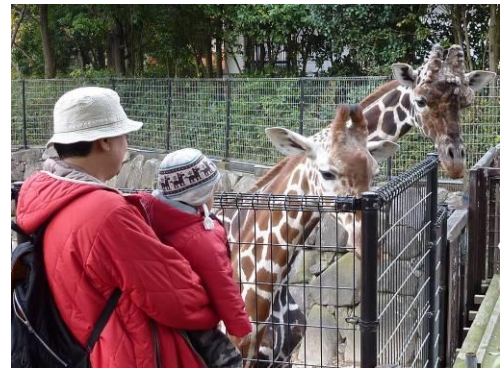
アミメキリンと記念撮影

※雨天順延の場合、インドゾウ②の回は中止となり、「わくわくタイム ゾウにおやつをあげよう」を開催します。